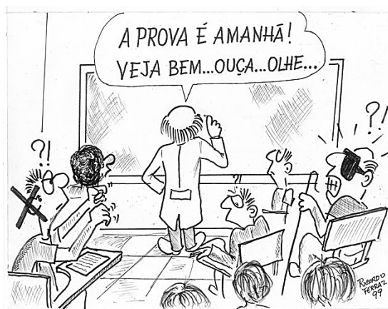
FERRAZ, Ricardo. A prova é amanhã! Veja bem... ouça... olhe... [Charge]. 1999. Disponibilizada em: Nathi explorando valores . Sem link específico encontrado. Acesso em: 11 out. 2025.

A imagem representa o grande desafio da contemporaneidade relacionado às derrubadas de barreiras para lidar com alunos com deficiência. De acordo com a Lei Brasileira de Inclusão da Pessoa com Deficiência (LBI), Lei nº 13.146/2015, as barreiras são definidas como qualquer entrave que limite ou impeça a participação social da pessoa, bem como o gozo, a fruição e o exercício de seus direitos à acessibilidade. De acordo com a LBI, na figura, observa-se que para a inclusão dos alunos com deficiência é necessário derrubar quais barreiras?